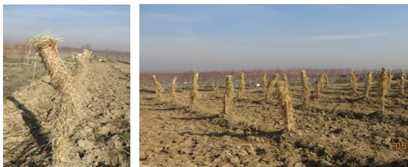
حفاظت نهالی های تازه غرس شده انار از یخزدگی توسط کاه در فارم تحقیقاتی دهادی مزارشریف