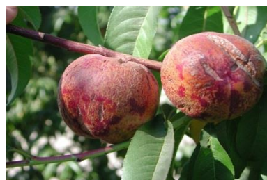
ترک ها در میوه ناشی از کمبود فاسفورس