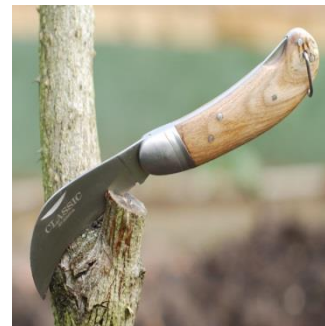
چاقوی شاخه بری Pruning knife