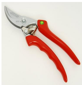
قیچی کوچک شاخه بری Shears