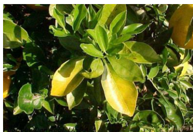
زردی تمام برگ ناشی از کمبود نایتروجن

روش دیگر استفاده از کود حفر نمودن سوراخ های کوچک است این روش زحمت بیشتر دارد، اما از ناحیه این که کود به ریشه های درخت میرسد مطمئن میباشیم. یک چقرک 40 در 30 را به عمق 15cm به فاصله 30 سانتی متر دور تر از تنه درخت حفر نمائید و بعداً کود اضافه نمائید. زمانیکه کود دهی را تمام نمودید یک اندازه کمپوست نیز بالای آن اضافه نمائید و سپس آنرا آبیاری کنید.