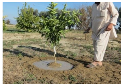
روش آبیاری تشتی