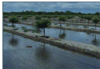
روش آبیاری سیلابی