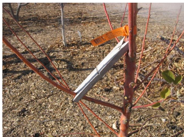
برای ساختن 45 درجه زاویه از جدا کننده استفاده نمائید