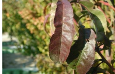
رنگ بنفش بر روی برگ کمبود فاسفورس