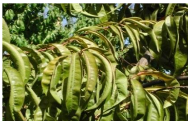
الیازها یا رول خوردن برگ و رنگ پریده برگ کمبود پتاشیم