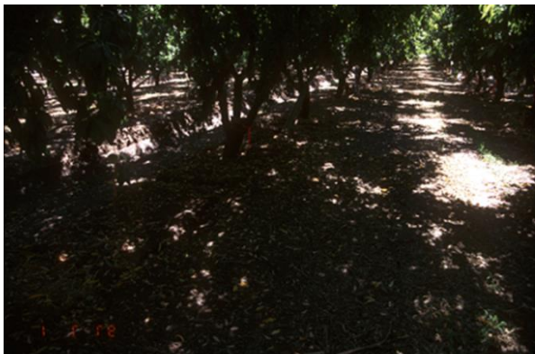
شاخه بری نور را کنتر و تنظیم مینماید. نور بیشتر = میوه بیشتر