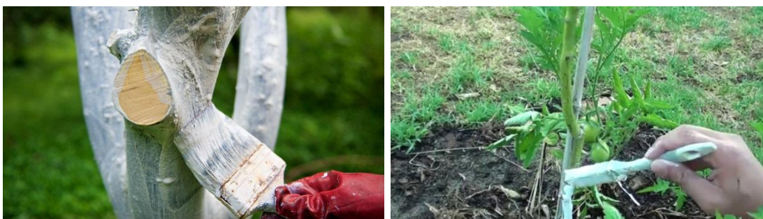
حفاظت درخت از آفتاب سوختگی

جلوگیری از یخزدگی نهال های تازه غرس شده با استفاده از روش پوش نمودن نهالی ها توسط کاه: