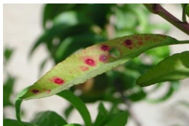
داغ های سرخ در برگهای شفتالو از اثر کمبود نایتروجن