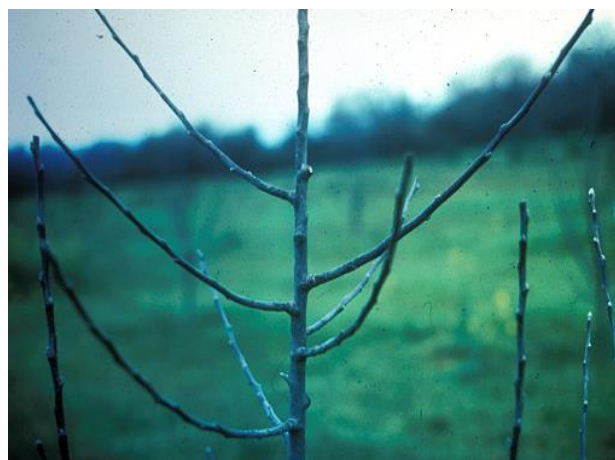
بهترین زاویه، زاویه 45 درجه (منبع تصویر: Robert Ll. Morris)

تاقه کاری (Thinning Cuts) را جهت نگهداری جوانه های انتهایی (Terminal Buds) بکار میبریم تا جوانه های جانبی (Side Buds) را کنترل نماید. (منبع تصویر: Robert Ll. Morris)