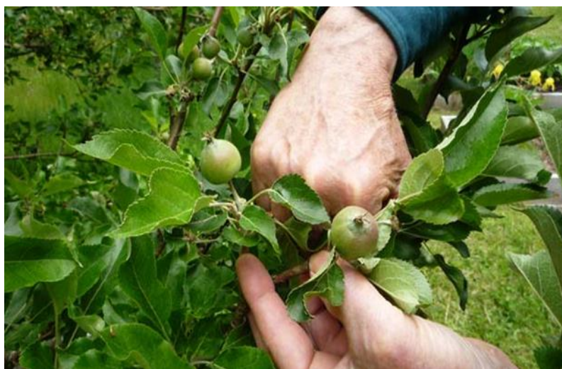
برای اندازه گیری فاصله بین دو میوه مشت خویش را استفاده نمایند