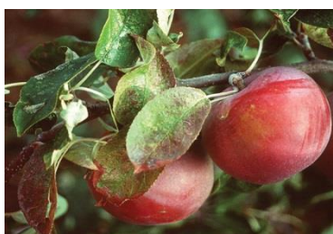
سوختن و حلقه زنی برگ از اثر کمبود پوتاشیم