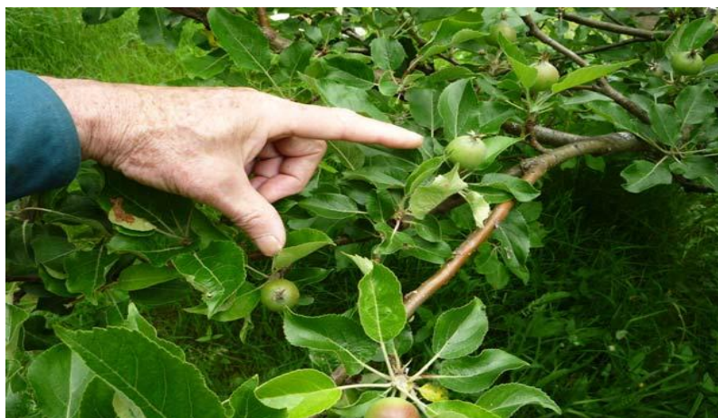
زمانیکه یکه کاری تمام شد شاهد چنین حالت میباشید