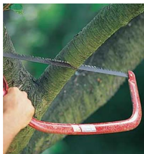
اره ای کمان مانند Bow saw