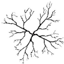
شاخه بری برای تنظیم و تربیه درخت