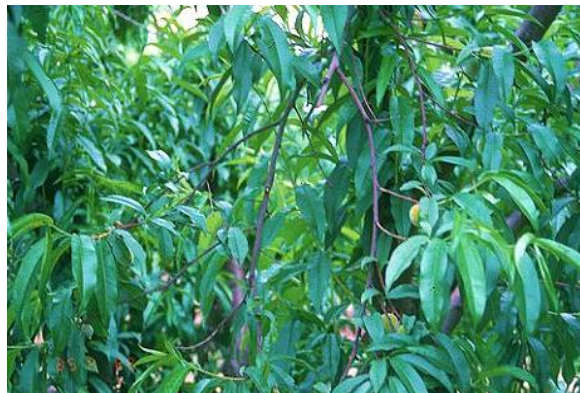
برگ های داخل درخت به دلیل نبود نور به داخل میریزند