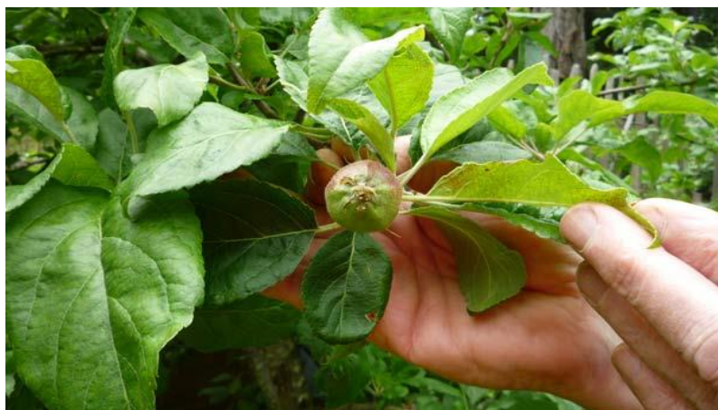
وقتی که یکی از این دو میوه را به هدف یکه کاری برداشته یک میوه باقی میماند