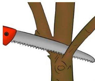
اره شاخه بری Pruning saw