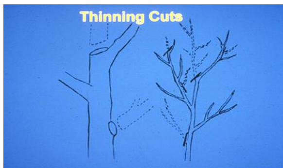
تاقه کاری یا Thinning cut