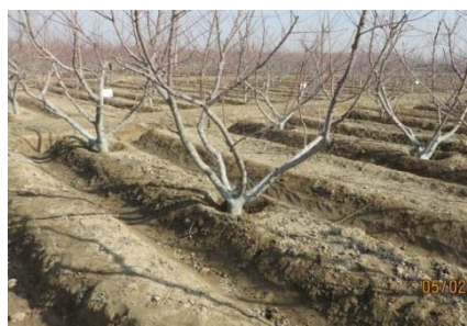
روش آبیاری به شکل جویه