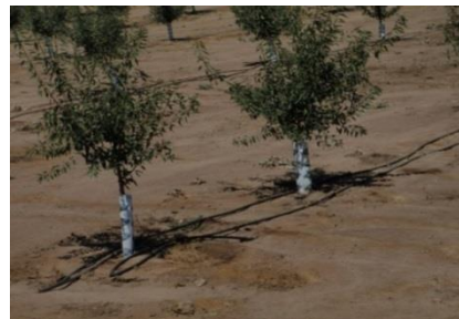
روش آبیاری قطره ای