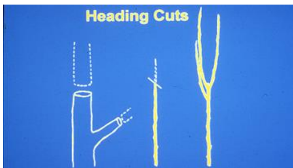
سرزنی یا Heading Cut