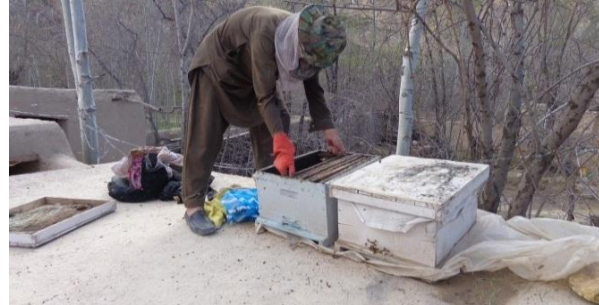
حذف صندوق فوقانی و تنظیم چوکات های داخل صندوق

3. جاهای خالی صندوق زنبور عسل را توسط پارچه های نخی که رطوبت را بگیرد و برای زنبور ها ضرر نداشته باشد پر نماید.