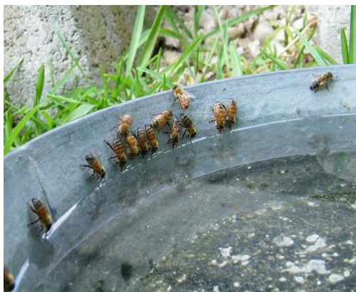
در صورت نبود منابع آب، آب را بصورت مصنوعی تهیه شده