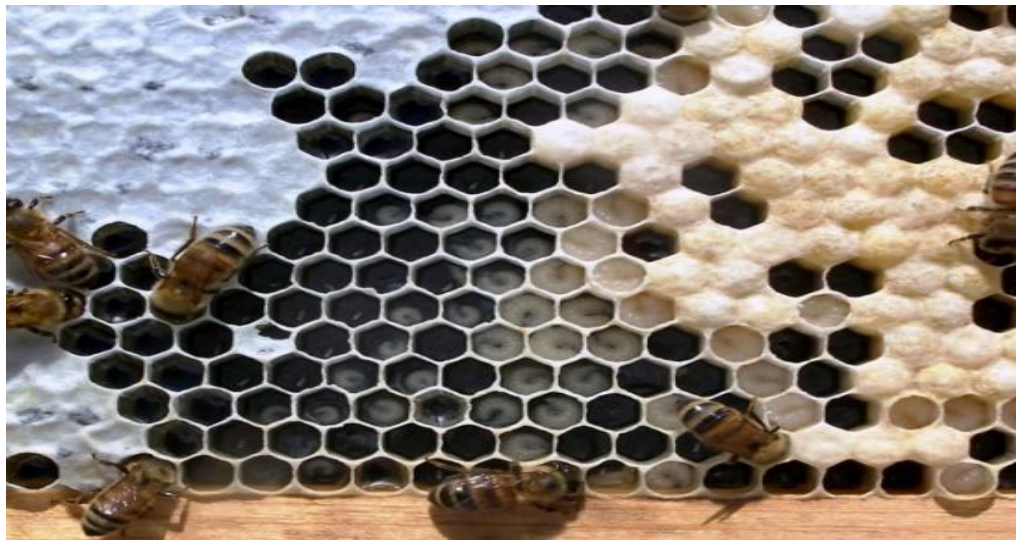
در جریان بررسی صندوق در داخل چوکات تخم، لاروا، شفیره بسته و عسل دیده میشود که نشانی یک فامیل صحتمند را بیان میکند