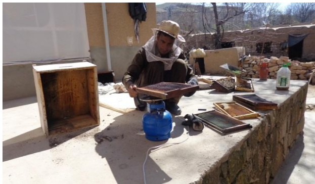
ضد عفونی کردن چوکات ها توسط آتش و پاک کردن صندوق

ب: چوکات های خراب را از صندوق دور نموده و چوکات های نو همرا با موم را جایگزین آن نمایید، همچنان چوکات های قبل استفاده شده باید با آتش ضد عفونی شود و صندوق همراه با چوکات ها باید خشک و پاک نگهداری شود.