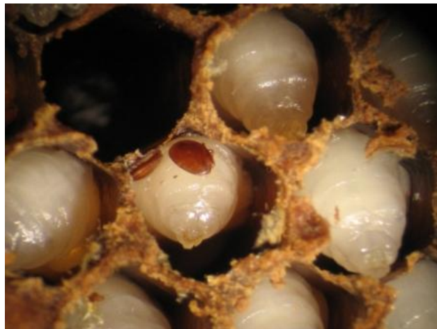
کنه وروا در جریان تغذیه خون زنبور بالغ و شفیره باز

انتقال مرض: طوریکه قبلاً ذکر گردید فامیل های مبتلای زنبور عسل به مرض توسط کنه ها، ضعیف میشود این فامیل های ضعیف زنبور عسل توسط زنبور های قوی و صحتمند چور میشود. به این ترتیب مرض کنه ها به فامیل های صحتمند نیز سرایت میکند.