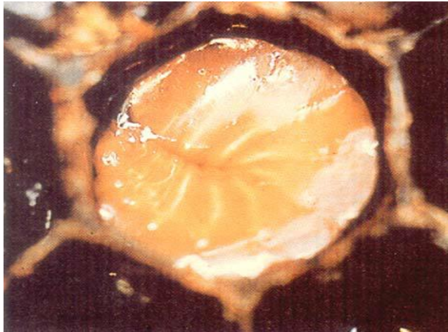
علائم مرض اورپایی