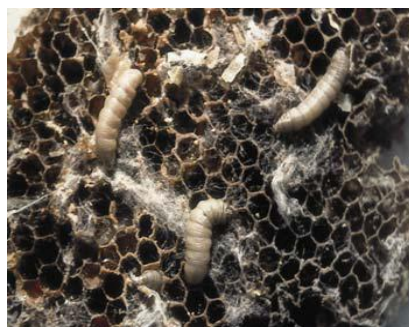
لاروای موم خوار و ضرر های آن

تداوی مرض: این مرض توسط اوکسی تتراسکلین میتواند تداوی و شیوع آن کنترل نمایند لیکن عسل که بعد از تداوی بدست می آید در آن انتی بیوتیک از وقت تداوی میماند که برای انسانها مضر خواهد بود. لیکن روش بهتر این است تا اول چوکات های مبتلا به مرض جمع آوری و سوختانده شود، چوکات های باقی مانده در صورت امکان توسط آب گرم همراه با صابون شسته شود و بعداً تداوی توسط انتی بیوتیک ها شروع شود.