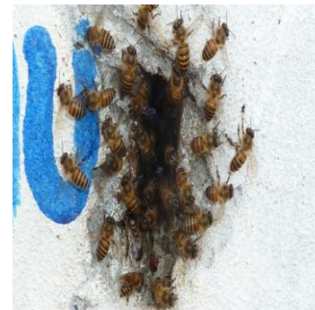
خانواده آپیس سرینا در سوراخ دیوار

طبقه بندی و وظایف زنبور عسل: زنبور عسل یک حشره مفید و اجتماعی است که در یک فامیل با هم زندگی مینمایند. یک خانواده قوی زنبور عسل شامل یک ملکه، در حدود ۱۰۰ زنبور (مذکر) و ۵۰۰۰ زنبور مونث (کارگر) میباشد. هر فامیل زنبور عسل دارای تخم - لاروا و نمف میباشد و هریک از اعضای فامیل زنبور عسل داری وظایف مخصوص میباشد که در پایین تشریح شده است.