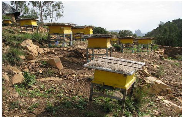
تهیه سایه مصنوعی بالای صندوق ها در فصل گرما

2- آب را در داخل بیرل بیندازید و با یک پیب باریک همراهی سطح قبلاً با پلاستیک پوشانیده وصل نمایید ، توت های کوچک سنگ و چوب را داخل قسمت پوشیده شده با پلاستیک بگذارید و آب را بطور قطره یی جریان دهید. تا زنبورها به آسانی آب مورد ضرورت خود را بیگردند، ضرورت تهیه کردن آب به زنبور ها نظر به موسم فرق میکند. اگر هوا زیاد گرم باشد زنبور به آب فراون ضرورت دارند و به جای گرده گل آب می آورند برخلاف اگر هوا سرد باشد، به آب بسیار کم ضرورت دارد. نظر به تجارب نویسنده تهیه آب در نزدیکی فارم زنبور پروری و در فصل گرمی گذاشتن صندوق های زنبور عسل در سایه تولید عسل را 50 فیصد بیشتر مینماید.