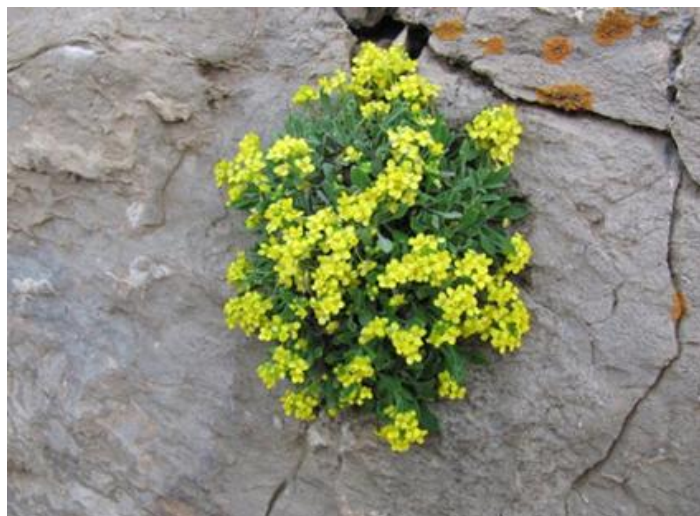
گل سنگ یک بته مشهور کوهی برای تغذیه زنبور