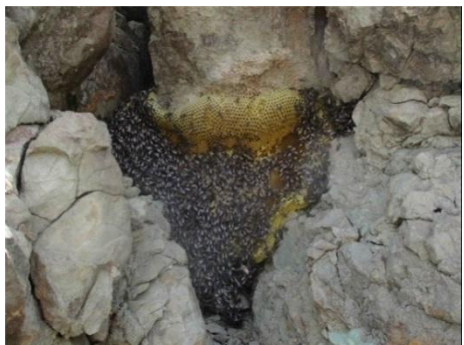
یک فامیل نوع سیرنا در بین سنگ ها