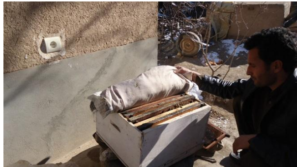
باز نمودن صندوق در وقت زمستان بخاطر تغذیه کردن

7. اگر شما ضرورت دارید که زنبور عسل خویش را در ماه های زمستان تغذیه نمایید، این فعالیت را در روزهای نورمال افتابی که درجه حرارت در حدود 10 الی 12 سانتی گراد باشد اجرا نماید- سرپوش صندوق را کم باز و به سرعت زنبور ها را تغذیه نماید هر چقدر به سرعت این فعالیت اجرا گردد بهتر خواهد بود تا داخل صندوق زیاد سرد نشود.