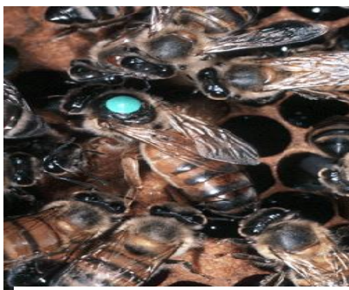
در تصویر بین زنبو ها ملکه برای شناسایی آن رنگ شده است

ملکه زنبور عسل یک زنبور مونث القاح شده است که معمولاً یک ملکه در یک صندوق موجود میباشد، ملکه شبیه به زنبور های کارگر است ولی شکم آنها دراز تر است. وظیفه ابتدایی زنبور ملکه یکجا شدن با زنبور مذکر است که بعداً تخمگذاری مینماید - ملکه زنبور عسل دارای شکم بزرگ میباشد که قادر به تخمگذاری زیاد در یک روز میباشد. در فصل بهار مخصوصاً در ماه حمل طی 24 ساعت حدود 2000 تخم میگذارد. ملکه توسط زنبورهای کارگر تغذیه و پاک نگهداری میشود. زنبور ملکه میتواند تا 6 سال تخم گذاری نموده و زنده باقی بماند مگر تخم گذاری ملکه بعد از 2 سال کمتر میشود - بدین وسیله برای زنبورداران پیشنهاد می شود که هر 2 سال بعد زنبور ملکه خود را تبدیل نمایند.