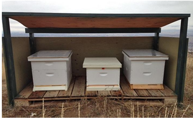
کالونی های زنبور در یک جای مناسب برای زمستان گذرانی

6. رطوبت یک مشکل جدی برای کالونی های زنبور عسل شمرده میشود برای جلوگیری نم و هوای سرد اضافه نمودن تکه ها به جای خالی در داخل صندوق زنبور و مهیا نمودن تهویه- هوا باید از طرف پایین در صندوق داخل و از بالای صندوق خارج شود در نظر گرفته شود.