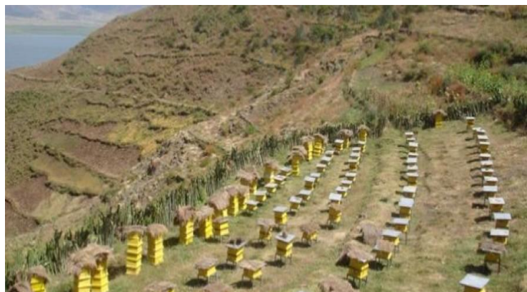
یک جای مناسب انتخاب شده از لحاظ موجودیت منابع گل