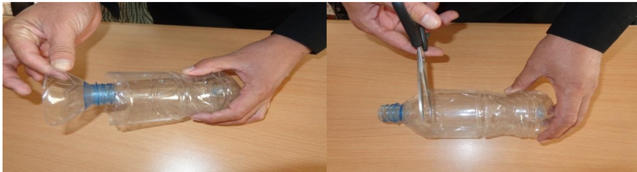
مراحل اول و دوم ساختن تلک پلاستیکی زنبور های وحشی