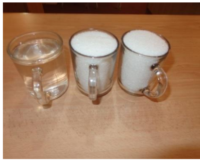
اندازه بوره و آب برای تهیه نمودن شربت غلیظ