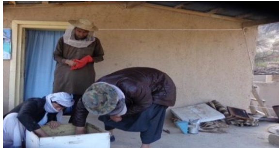
پاک کردن صندوق های زنبور عسل

2. قبل از اینکه زمستان بیاید، داخل کندو های زنبور عسل را پاک نمایید. اگر تعداد زنبور ها زیاد نباشد، صندوق فوقانی را حذف نمایید و چوکات ها را در داخل صندوق باقیمانده تنظیم نمایید.