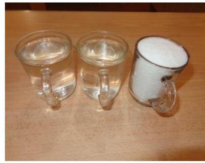
اندازه بوره و آب برای تهیه نمودن شربت رقیق

روش اول: صندوق زنبور عسل را باز نمایید و چوکات های خالی را بیرون بکشید- مستقیماً شربت بوره را در داخل حجرات (خانه های چوکات) برزانیید، این عمل ریختن را میتوانیم توسط ظرف آب یا توسط آب پاش انجام دهیم و پس چوکات ها را به داخل صندوق انتقال دهید بصورت عموم این عمل در فصل بهار و خزان واقع میشود.