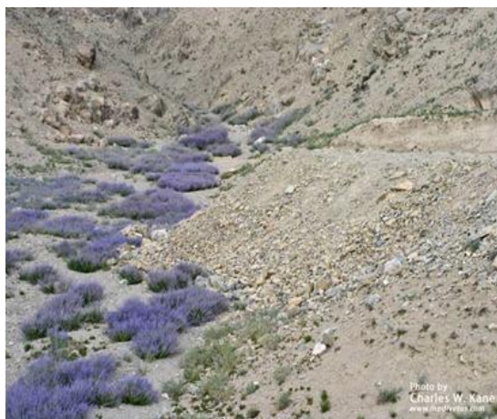
بته های گل مریم در یک دره