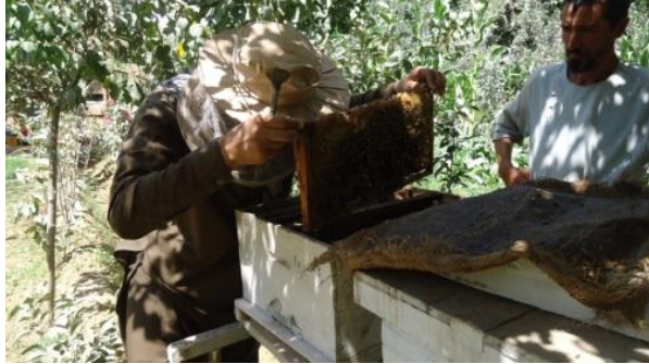
دیدن داخل صندوق زنبور عسل بخاطر ذخیره غذای زمستانی

افغانستان یک زمستان طولانی و سخت دارد. پس ضرورت است که برای آن آمادگی کافی داشته باشیم تا از زنده ماندن زنبور ها مطمئن شویم، تا زنبورها این فصل را به کامیابی سپری کند. در ذیل برای آماده گی زمستان چند سفارش توصیه میشود.