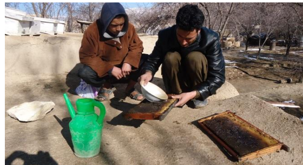
انداختن شربت شکر در داخل جوکات برای تغذیه