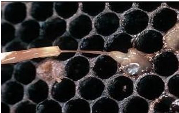
تجربه چوب گوگرد

انتقال مرض: عامل این مرض به صورت اسپور همراه با غذا توسط زنبور کارگر وارد بدن لاروا های جوان میشوند و در سیستم هضمی آنها رشد و تکثیر میکند. در داخل بدن لاروا های انکشاف یافته نمیتواند رشد نماید چون محیط برایش چندان مناسب نیست ولی پس از اینکه لاروا تبدیل به شفیره شود دوباره محیط برایش مساعد شده و به سرعت به تکثیر پرداخته شفیره را می کشد. و قتیکه زنبور کارگر حجره را پاک میسازد و شفیره را از حجره بیرون میکشد سپور های عامل مرض در داخل صندوق پخش میشود.