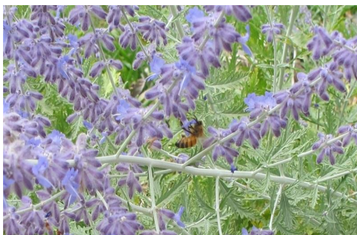
زنبور عسل در وقت تغذیه کردن از گل مریم

تصاویر بعضی از بته های وحشی و تیلی قرار زیر است: