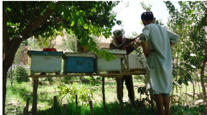
گذاشتن صندوق زنبور عسل در زیر سایه درخت