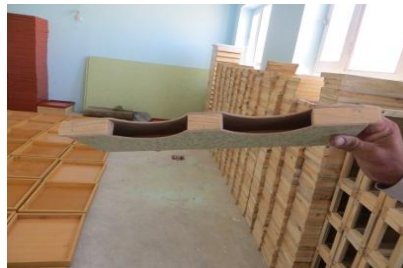
غذا خوره زنبور عسل

روش دوم: چوکات های موم دار را بشوید و نزدیک صندوق های زنبور عسل بگذارید: شربت را مستقیماً در حجرات شان برزانیید بعداً چوکات های پر شده را نزدیک به صندوق ها بمانیید. برای شما توصیه میگردد که این روش تغذیه را از طرف صبح روز های گرم و بدون باد انجام دهید، مقدار تهیه کردن شربت مربوط به فعالیت زنبور کارگر میشود که چه مقدار به داخل صندوق انتقال میدهند.