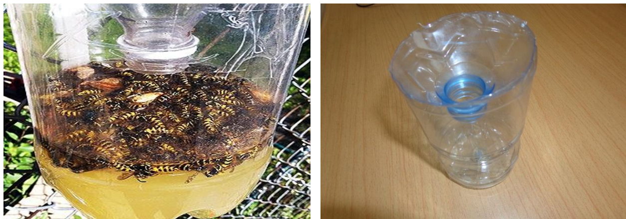
تلک ساده پلاستیکی و زنبور های به دام افتاده