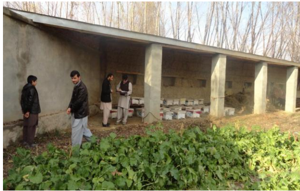
یکی از آماده گی های زمستانی