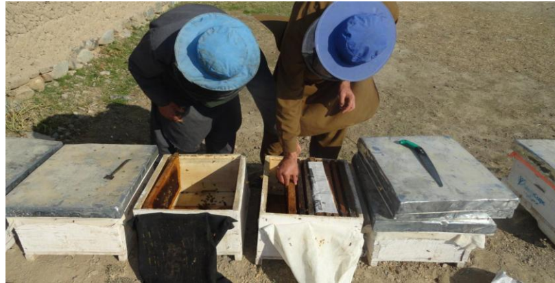
یکجا کردن دو کالونی در یک صندوق

ملکه ندارند در جمع صندوق های ضعیف شمرده میشود و ضرورت به یکجا کردن دارد. اما صندوق های قوی داری 6 چوکات پر از زنبور میباشند. یکجا نمودن صندوق های زنبور عسل بدین معنی نیست که زنبور های عسل را از یک صندوق به صندوق دیگر بیاندازیم: این عمل واقعا به زنبور ها صدمه وارد میکند. یکجا نمودن صندوق ها زنبور عسل به دقت و احتیاط ضرورت دارد. و این کار باید به بسیار مهارت انجام شود و توسط شربت بوره تغذیه شود. تا پروسه به درستی پیش برود. بهترین وقت برای یکجا کردن صندوق ها زنبور عسل آخر تابستان و اوایل خزان میباشد و برای یکجا نمودن دو صندوق زنبور عسل نقاط ذیل را در نظر گرفته شود.