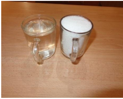
اندازه بوره و آب برای تهیه نمودن شربت متوسط