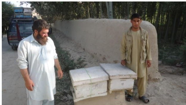
انتقال صندوقهای زنبور عسل به یک مکان دیگر توسط موتر

برای انتقال صندوق های زنبور عسل دلایل گوناگون وجود دارد که باید انجام گیرد مانند: برای گرده افشانی درختان و نباتات- گرفتن بیشتر تولید عسل و حفاظت زنبور عسل از آب و هوای نامناسب. انتقال دادن صندوق های زنبور عسل به فاصله نزدیک در داخل باغ یا حویلی و به فاصله دور از یک جای به جای دیگر صورت میگیرد.