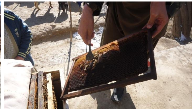
دور کردن چوکات موم خراب