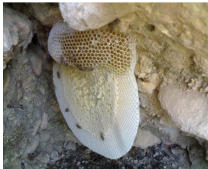
نمونه از خانواده آپیس سرینا