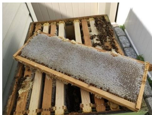
چوکات های مرکزی از عسل پر شده در جریان یک هفته به عسل کشی آماده میشود

در اواخر بهار و اوایل فصل تأبستان، لازم است تا برای کالونی های قوی طبقه نو اضافه شود، بخاطریکه زنبورها نیاز به یک فضای وسیع تر به منظور اجرای وظایف داخلی صندوق دارد، در غیر این صورت فعالیت های بیرونی کم خواهد شد. و در جریان چند روز ملکه نو تولید و خود را به گروه جدید آماده میکند. بهتر است صندوق ها بررسی شود، در جریان بررسی وقتیکه 5 چوکات مرکزی از عسل پخته پر شده باشد در این زمان همه چوکات های عسل رسیده عسل کشی شود و کالونی زنبور بهتر خواهند بود تا به یک جای مناسب که گل و منابع آب داشته باشد انتقال شود. و همانطوریکه در تأبستان هوا گرم میشود، کالونی ها زیر سایه انتقال شود تا از گل زیاد دیدن نماید که در نتیجه تولید عسل بالا میرود.